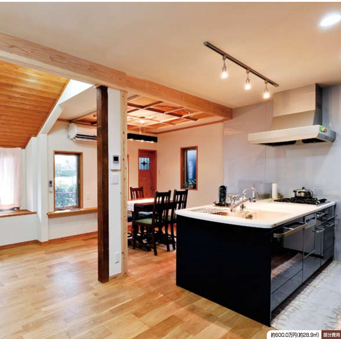
約600.0万円(約28.9㎡) 部分費用

不要な壁を無くし洗面室・浴室を移動させて広々としたLDKスペースを確保。対面式のフルオープンキッチンを採用することで、より開放感に満ちた室内となった。中央の柱や勾配天井など以前の住まいの面影を上手に残しながらナチュラルモダンな空間が提案されている